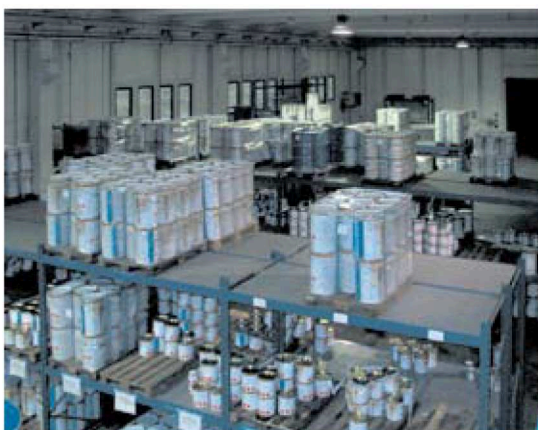
5 - Un'altra area di stoccaggio delle vernici all'acqua.