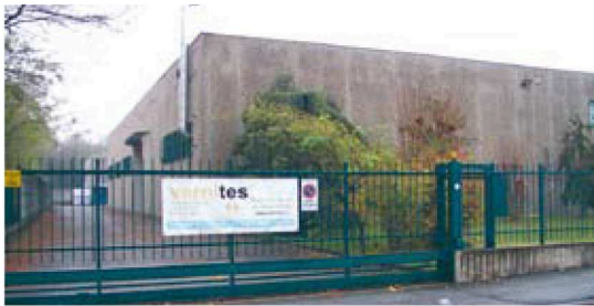
1 - L'ingresso della nuova sede. 2 - L'edificio di due piani.